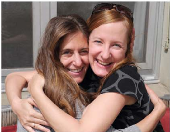
Ein Ergebnis von The Work: Nähe und Lebensfreude

oder ganz einfach, wenn Sie sich das Geschenk machen möchten, in diese heilende Arbeit einzutauchen.