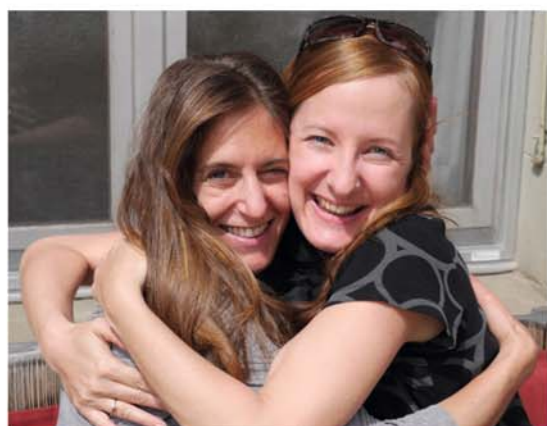
Ein Ergebnis von The Work: Nähe und Lebensfreude

oder ganz einfach, wenn Sie sich das Geschenk machen möchten, in diese heilende Arbeit einzutauchen.